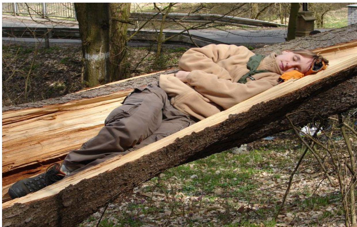
Vrchní druidka spí po rituálu Keltské noci

Údolní 58a, p.p. 388, 659 88 Brno info@jmpionyr.cz, www.jmpionyr.cz